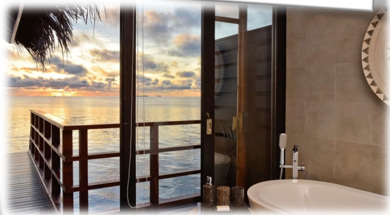
機場島飯店 Samann Host X 1 晚(或同級)