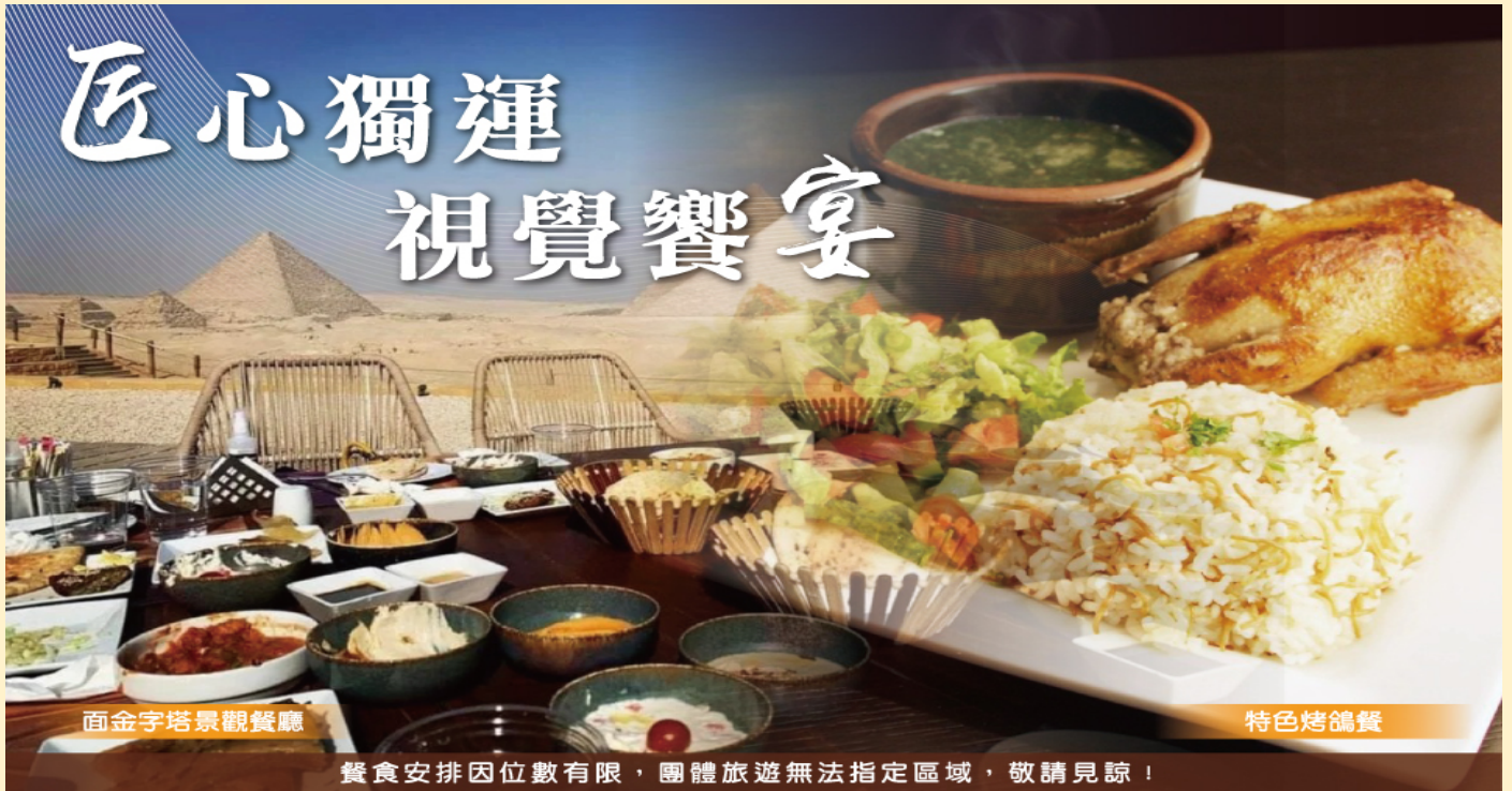
面金字塔景觀餐廳