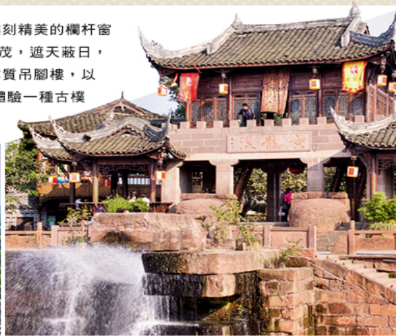
千年古鎮·清代建築的古樸寧靜