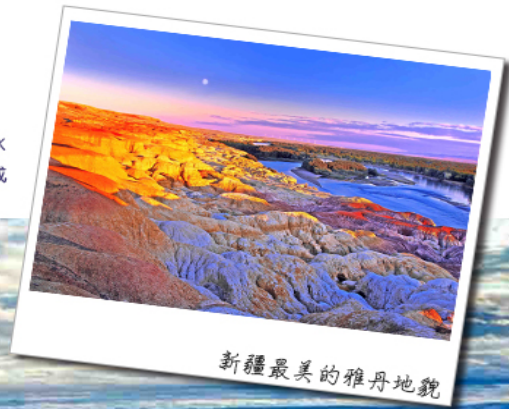
新疆最美的雅丹地貌