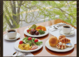
Lotte Hotel Ulsan