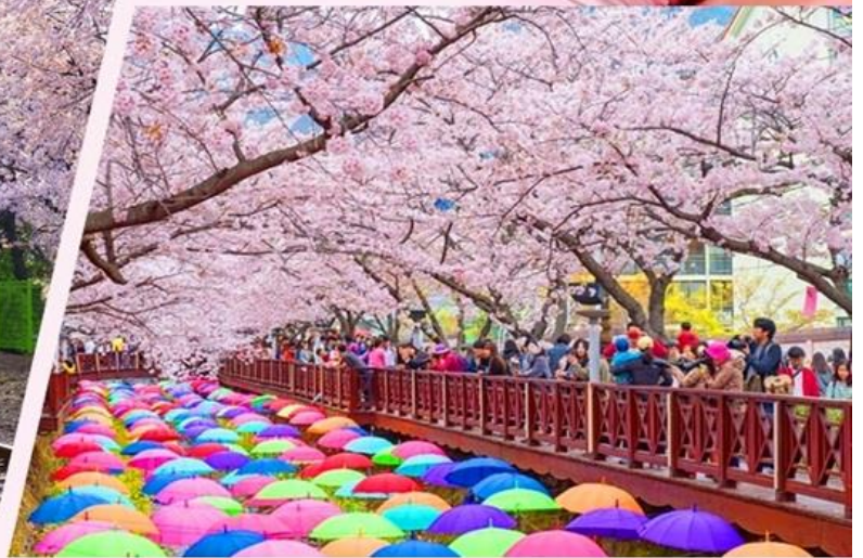
余佐川，曾是MBC電視臺戲劇《羅曼史》主要拍攝取景地，以身為鎮海賞櫻聖地為名。