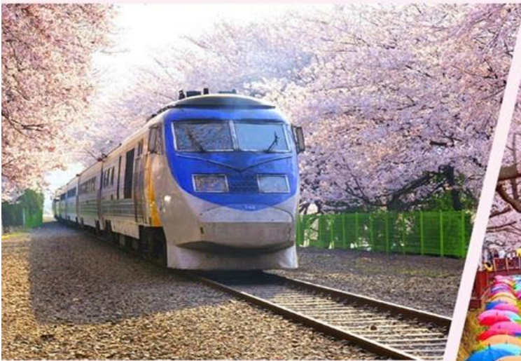
慶和火車站，路軌兩旁種滿了櫻花樹，景緻優美，是不少韓劇的取景處。