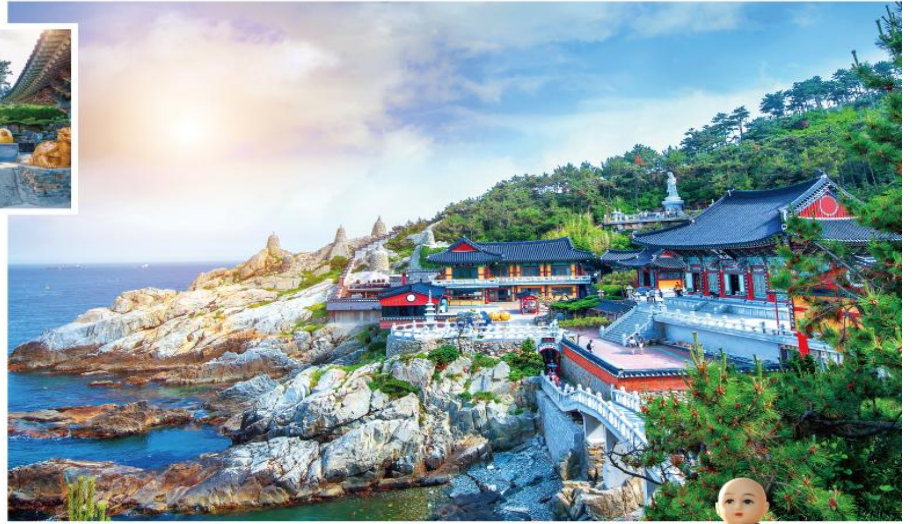
Haedong Yonggungsa Temple

原名普門寺，是韓國三大觀音聖地之一。傳說只要在此地真心誠意地祈禱，菩薩將會於夢中顯靈並實現一個願望。