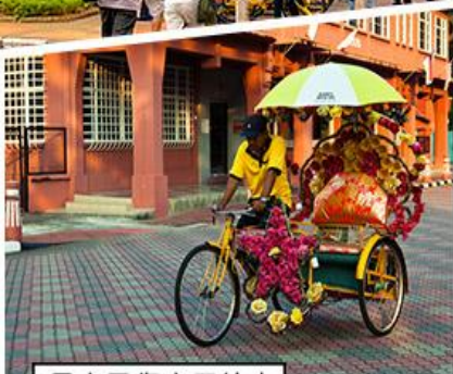
馬六甲復古三輪車