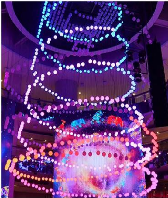
SkySymphony 光與聲的夢幻交響樂