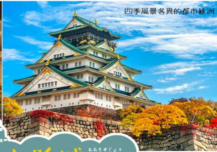
四季風景各異的都市綠洲