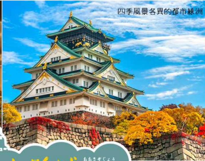
四季風景各異的都市綠洲