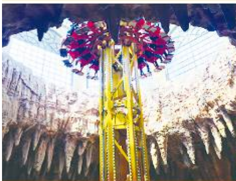
FANTASY PARK 夢想公園