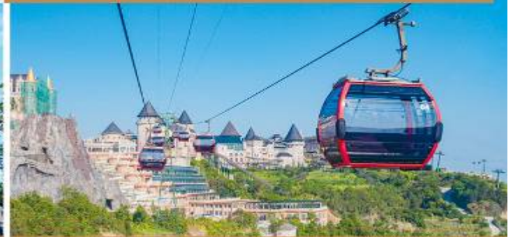
法式城堡巴拿山歡樂遊:搭乘纜車