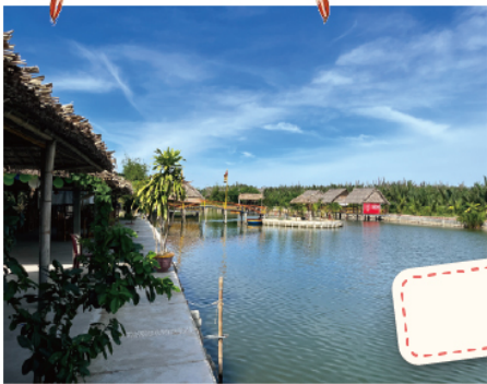
迦南島 花蟹火鍋 (每人一瓶飲料或啤酒)