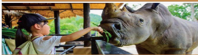
近距離觀賞、互動、餵食