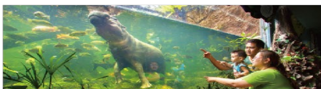
加贈有趣新奇的動物天性秀