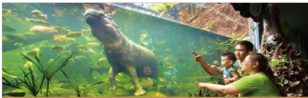
加贈有趣新奇的動物天性秀