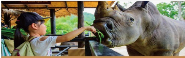
近距離觀賞、互動、餵食

充滿濃濃泰式風情的綠山國家公園，是東南亞最大的開放式動物園，飼養的動物種類多達300種，數量超過800隻，相當壯觀。這裡的動物不僅可以近距離觀賞，更可以餵食互動，除此之外，綠山國家動物園還準備精彩動物實景秀，讓您欣賞動物的神探模樣，如戲水的大嘴鳥、掠食的獅子、爬樹的老虎，種種難得畫面令人嘖嘖稱奇！